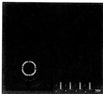
HIYG 64225 SBO